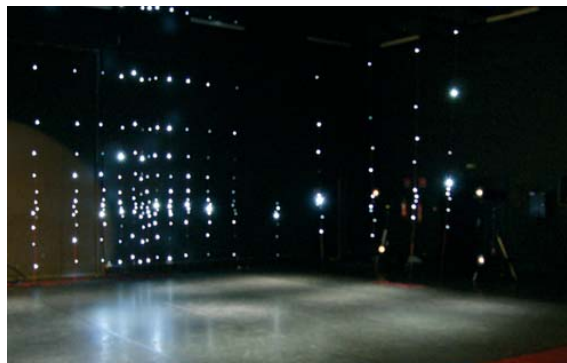
Dispositif scénique: cage de guirlandes de LEDs qui recrée le cadre de scène de la boîte noire épurée de tous les velours.

Chargée de diffusion : Aurélia Roche Livenais 06 66 15 87 80 / contact@29x27.com